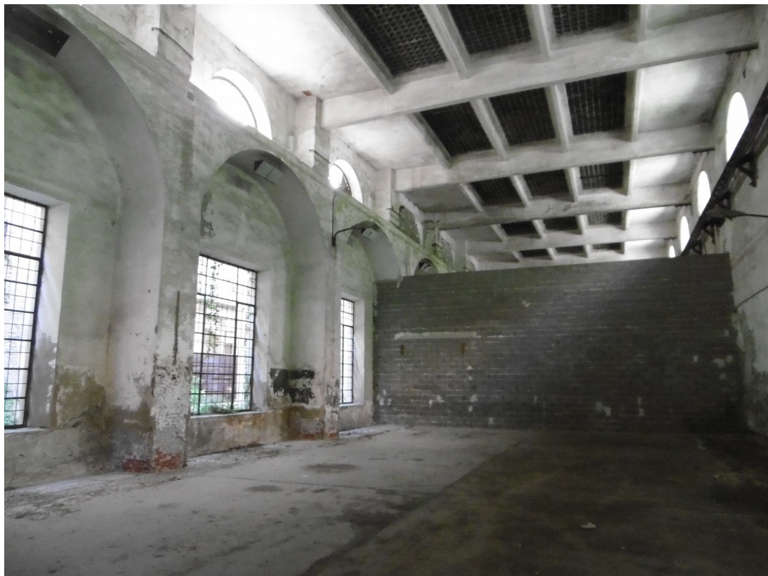
Foto 14: Capannone "F" oggetto di spostamento Archivio Giudiziario (interno)