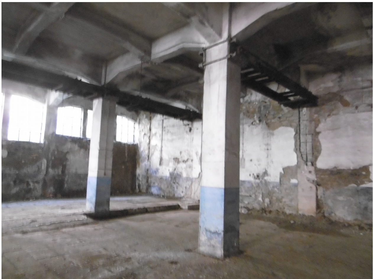
Foto 2: vista capannone B" oggetto di intervento (interno – dettaglio travi pilastri solaio)