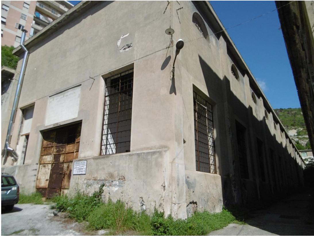
Foto 13: Capannone "F" oggetto di spostamento Archivio Giudiziario (esterno)