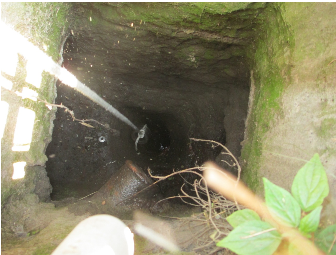
Foto 12: dettaglio deflusso tombinato visto dall'alto da chiusino con verifica speditiva quota fondo