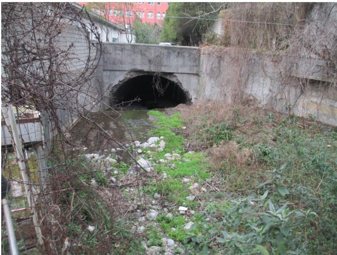
Foto 8: inizio tombinatura sotto Caserma Gavoglio (tratto a cielo aperto in corrispondenza Ponte don Acciai)