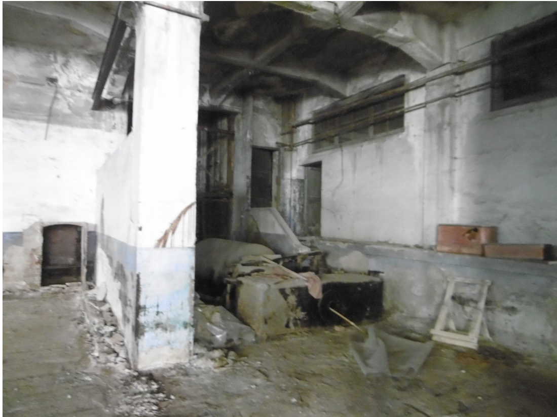
Foto 3: vista capannone B" oggetto di intervento (interno – dettaglio salto di quota in corrispondenza passaggio rio tombinato)