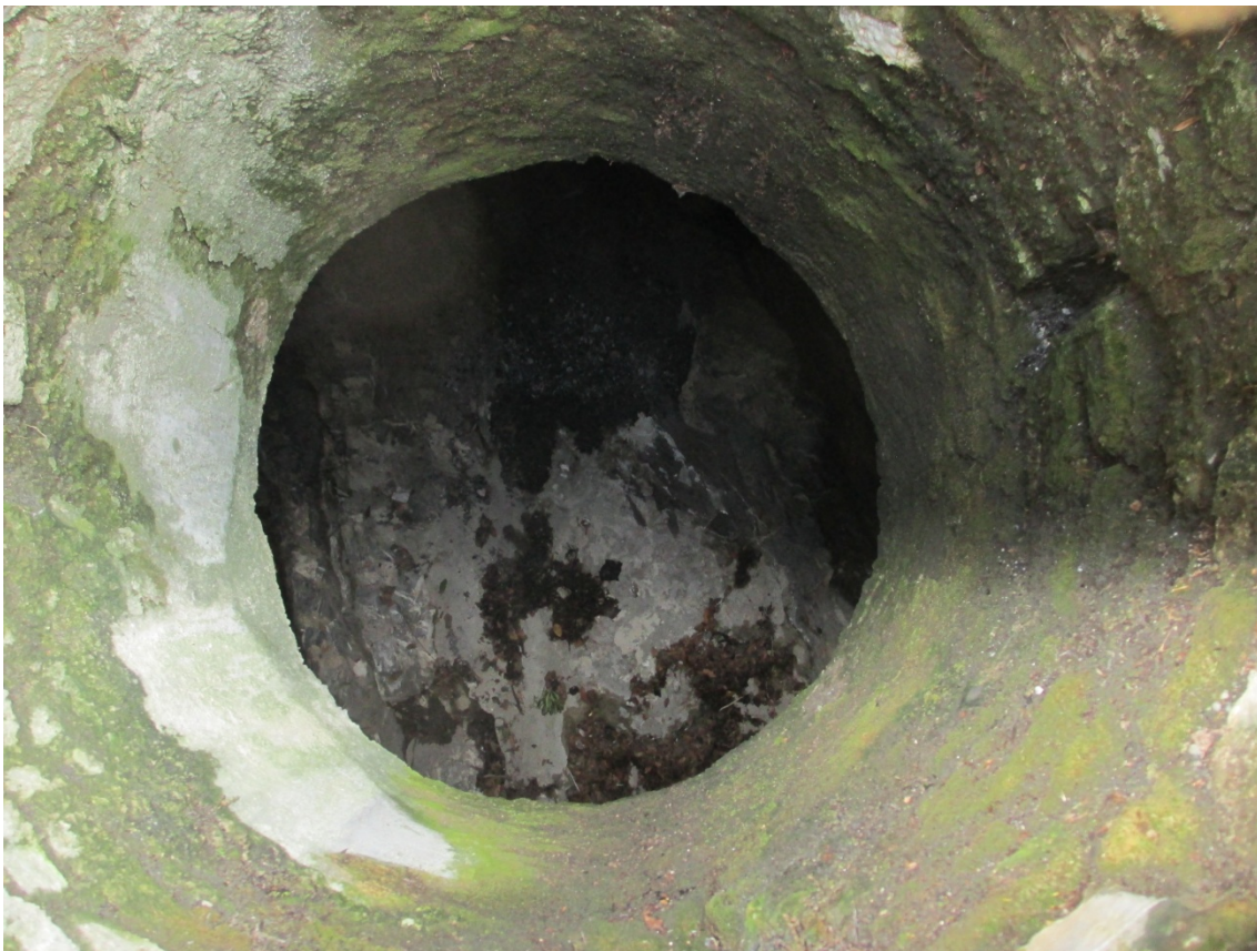
Foto 10: dettaglio deflusso tombinato visto dall'alto da chiusino (deflusso con presenza di acque nere)